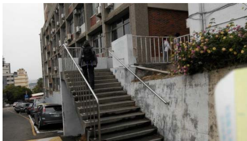
P15 停車場對面樓梯外觀示意圖