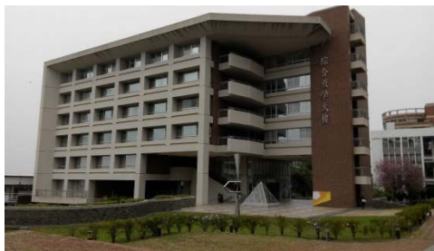
L 生活應用大樓外觀示意圖