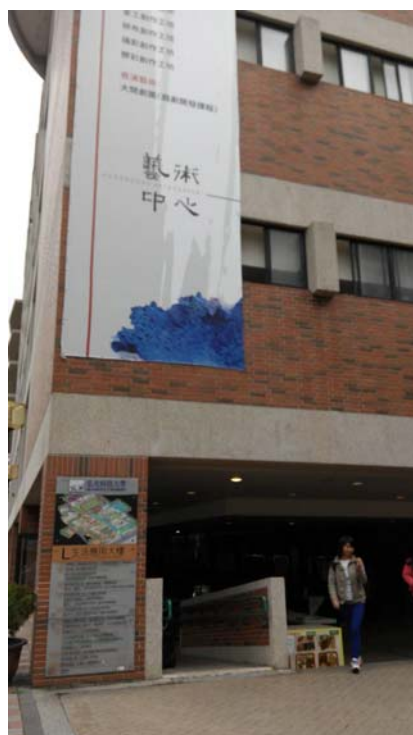
L 生活應用大樓外觀示意圖